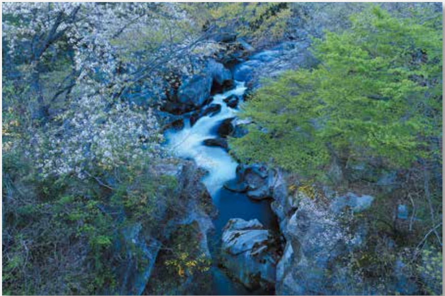
春の溪 白兔峽(滝野)