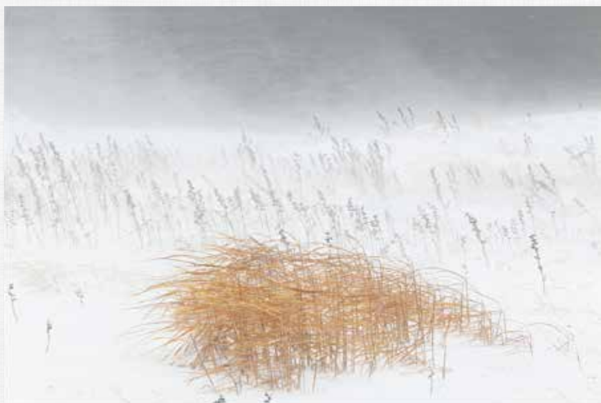
風雪 茂庭っ湖(名号)