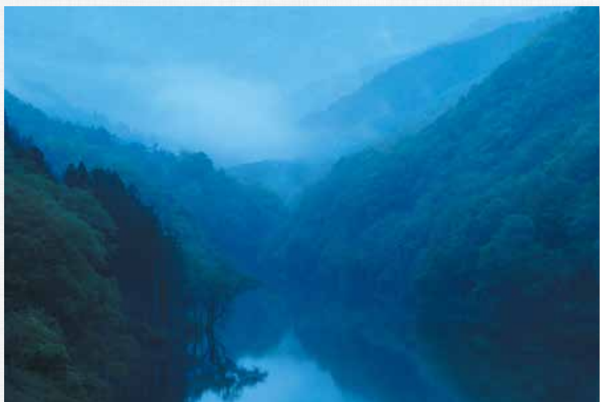
雨 露 茂庭の湖(叶道沢)