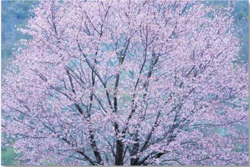
山 桜 田 畑