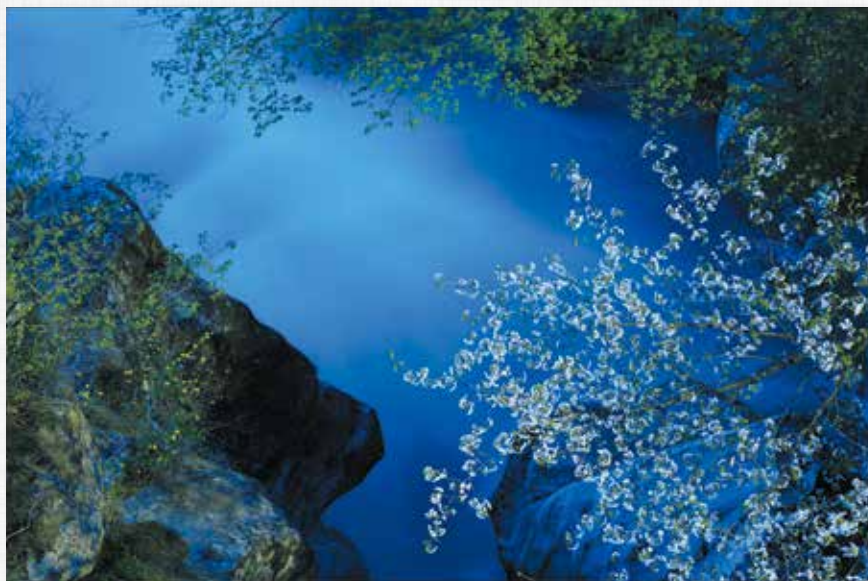
清 流 白兔峽(滝野)