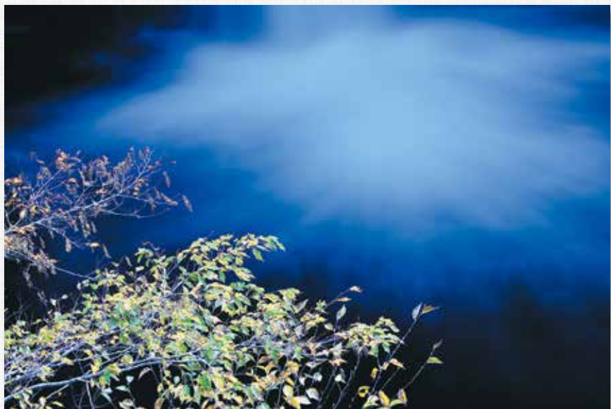
水花火 行人滝(中津川)