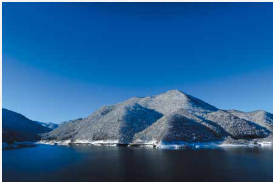
冬晴れ 茂庭っ湖(桂山)