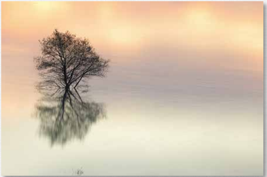
曙光 茂庭つ湖(名号)