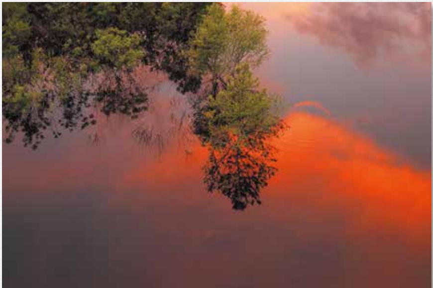
夕映え 茂庭っ湖(名号)