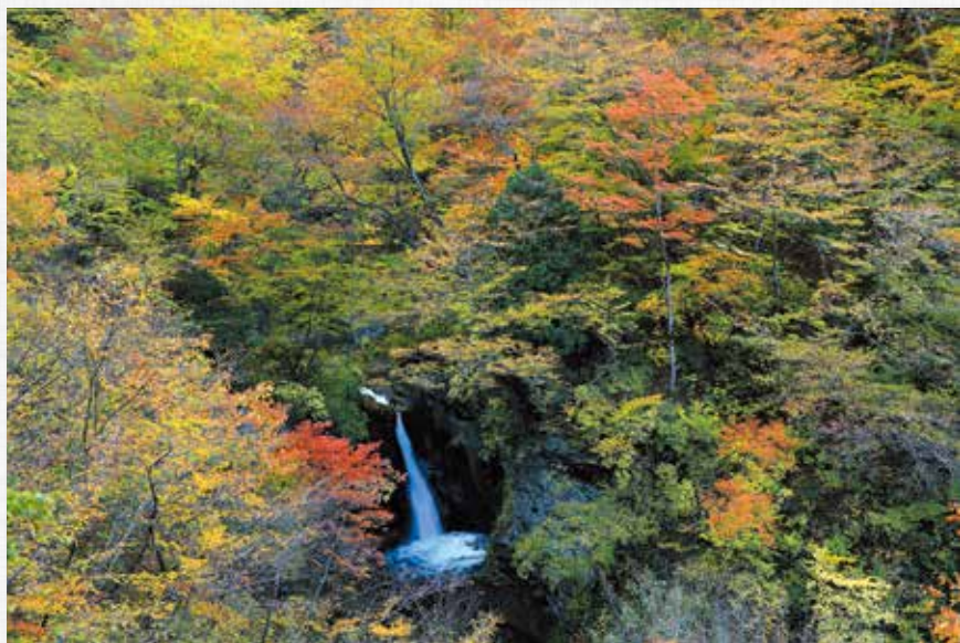
錦 秋 行人滝(中津川)