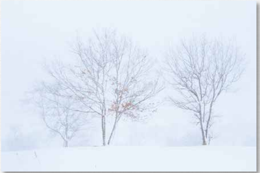
吹雪 茂庭広瀬公園