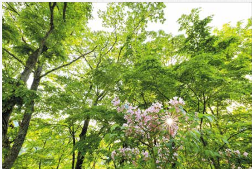
立 夏 名 号