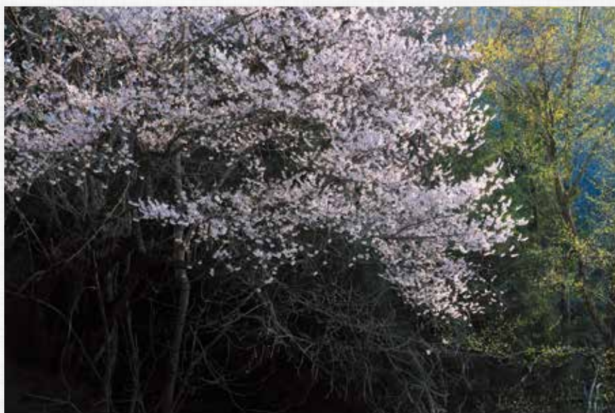
春 陽 高山沢(広瀬)