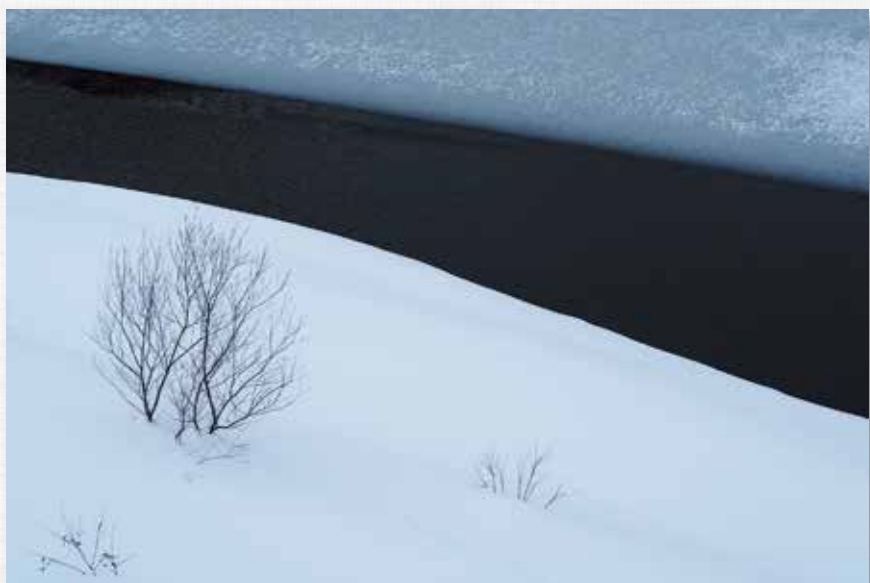
氷 結 茂庭っ湖(名号)