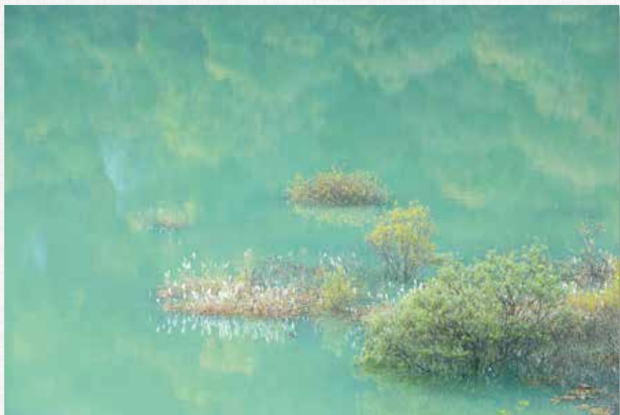
翠鏡 茂庭っ湖(名号)