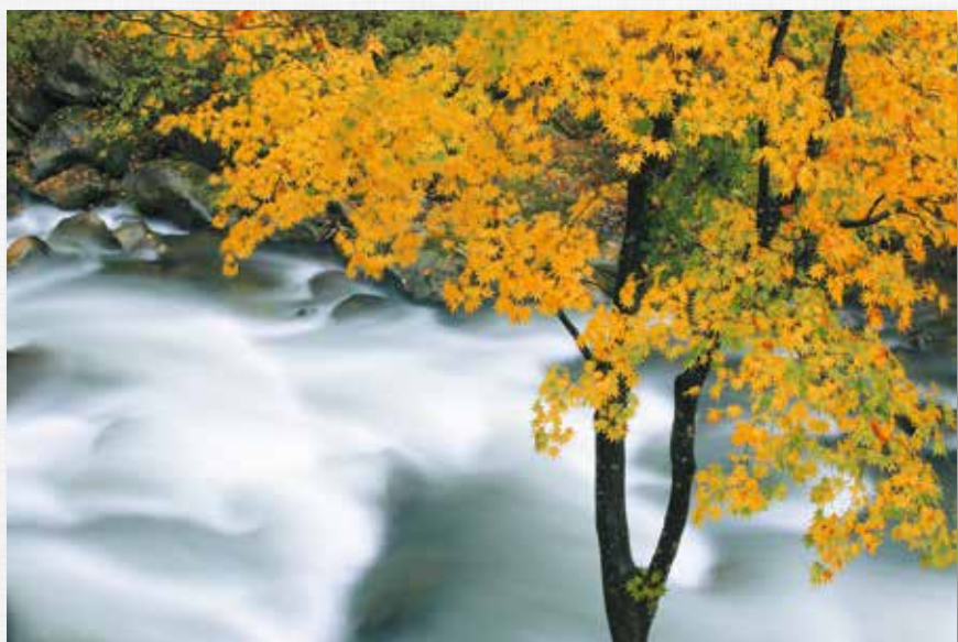
清 秋 摺上峽(滝野)