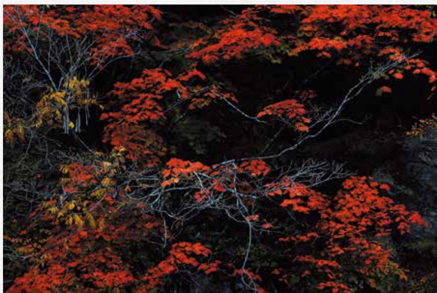
晩 秋 摺上峽(滝野)