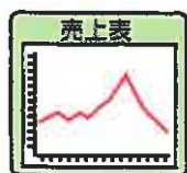
事故による 売上損失