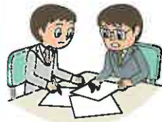
売上高減少の防止・軽減 営業継続費用